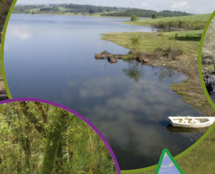
ROTEIROS DE SENDEIRISMO/ RUTAS DE SENDERISMO/ HIKING ROUTES