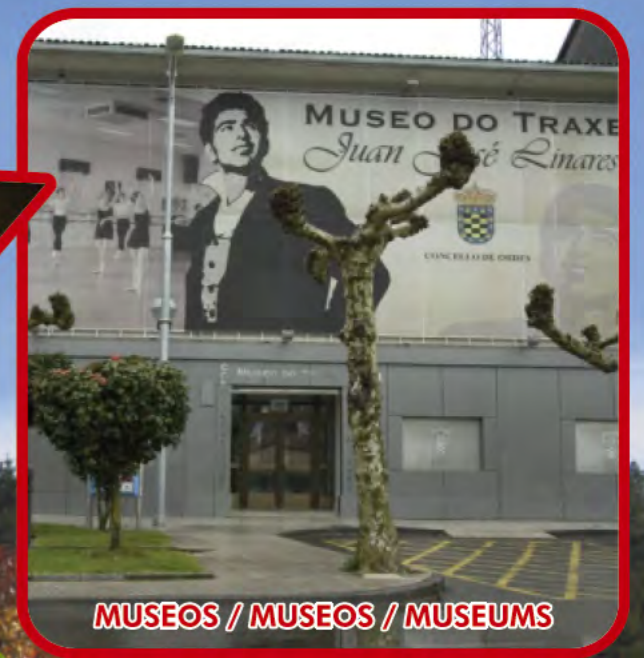
MUSEOS / MUSEOS / MUSEUMS