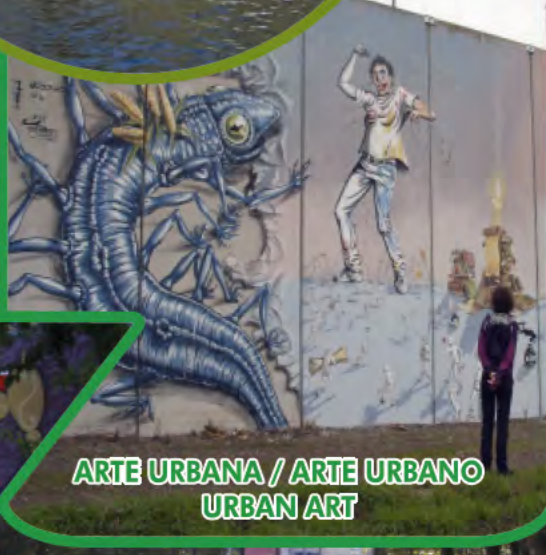
ARTE URBANA / ARTE URBANO URBAN ART

Está situado estratexicamente a medio camiño entre A Coruña e Santiago de Compostela.