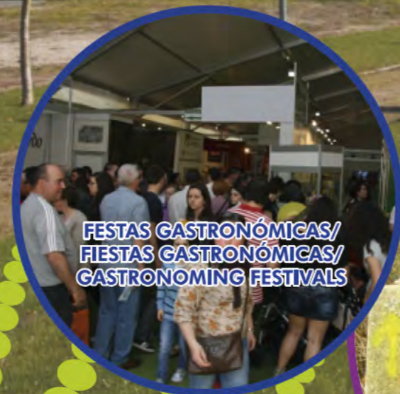
FESTAS GASTRONÓMICAS/ FIESTAS GASTRONÓMICAS/ GASTRONOMING FESTIVALS